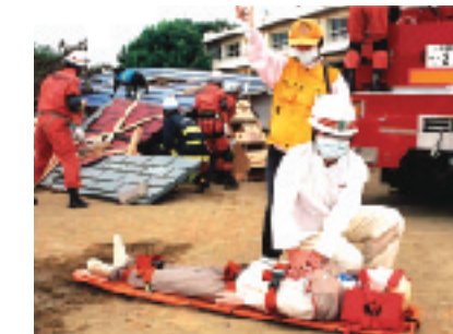
第28回 八都県市合同防災訓練 (9/1草野小)

千葉市を含む14大都市のいずれかが被災した際には、被災地以外の都市の医師会が救援にかけつけるという協定が、この秋に締結されました。千葉市医師会はこの協定にのっとり、行政と連携を保ちつつ被災地での医療活動にボランティアで参加することになります。千葉市が被災した場合も同様に、医療活動における人手が不足した場合には、他都市の医師会が救援にかけつけてくれることになっています。